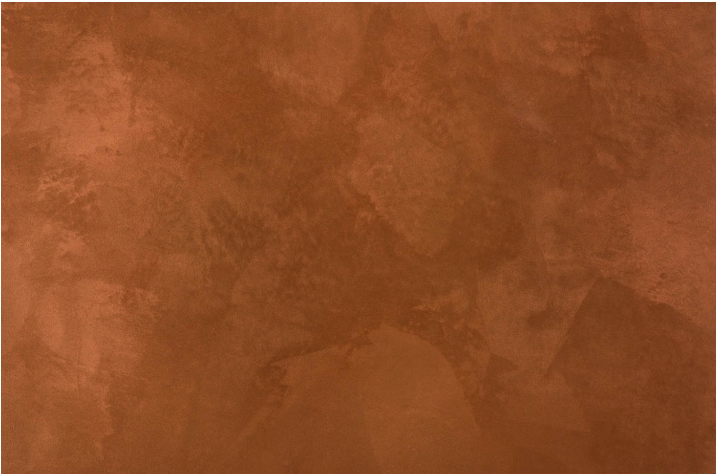
AB 02 Bronze