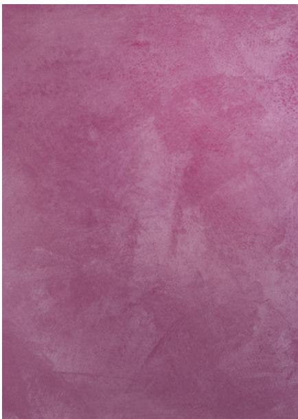
AV 27 Silver