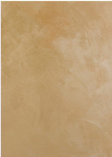
AV 11 Silver