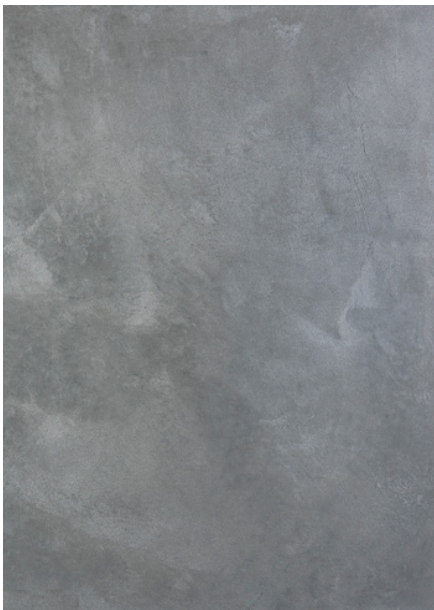
AV 20 Silver