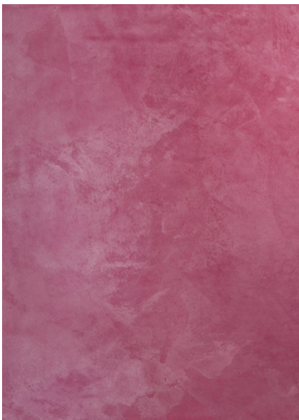
AV 26 Silver