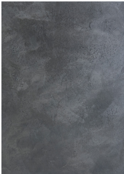
AV 21 Silver