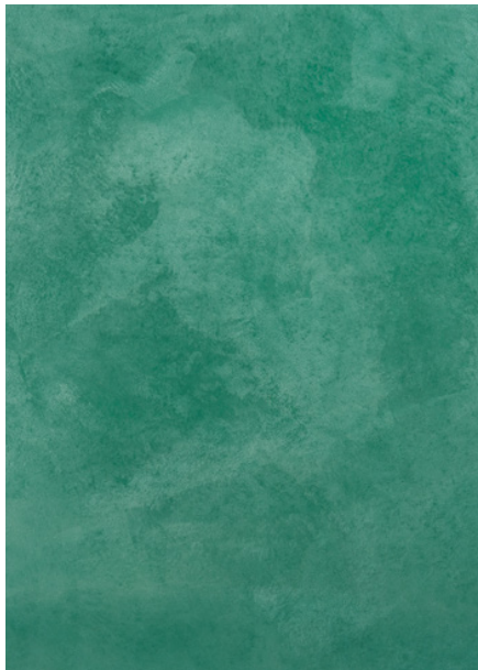
AV 22 Silver