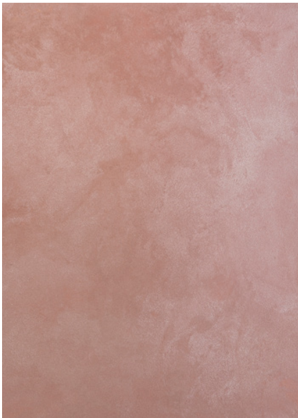
AV 10 Silver