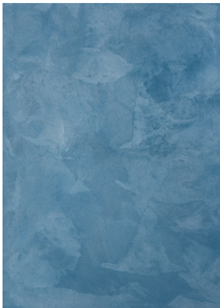
AV 04 Silver