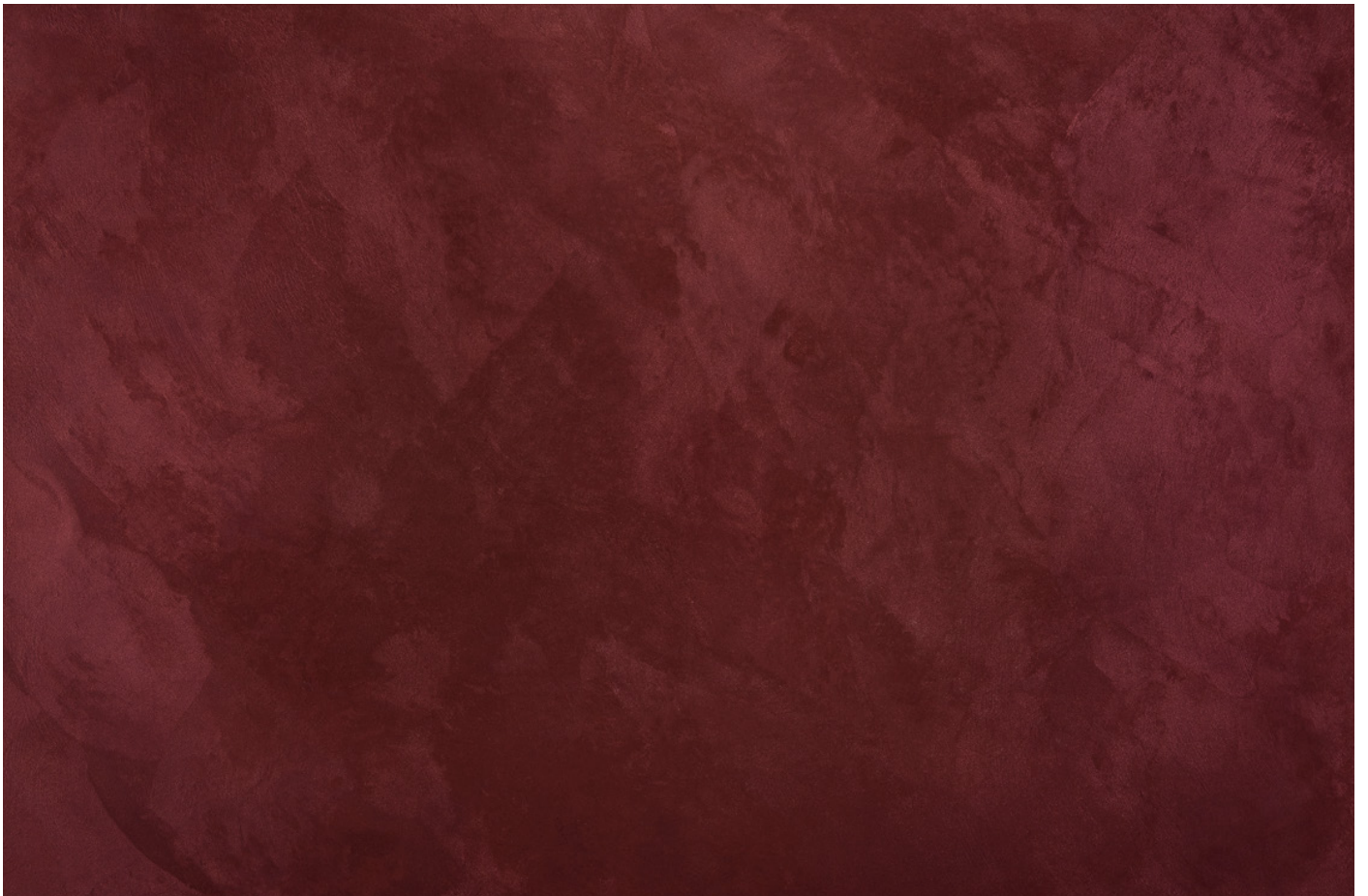
AM 02 Maroon